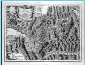
Beauvais, Carte de l'Oberland

Viaticalpes : Zugang zu einem aussergewöhnlichen Kulturgut über die Datenbank RIVES