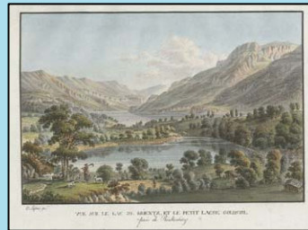
Lafond, Vue sur le Lac de Brientz

Donnerstag, den 11. März 2010 Burgerbibliothek Bern Münstergasse 63, 3000 Bern