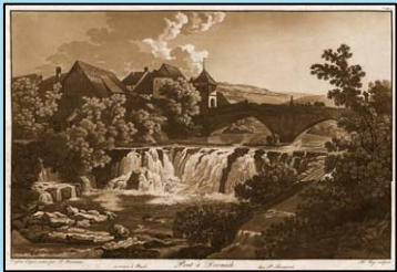
P. Birmann, Pont à Dornach

Viaticalpes : la mise en valeur d'un patrimoine exceptionnel au moyen de la base de données RIVES