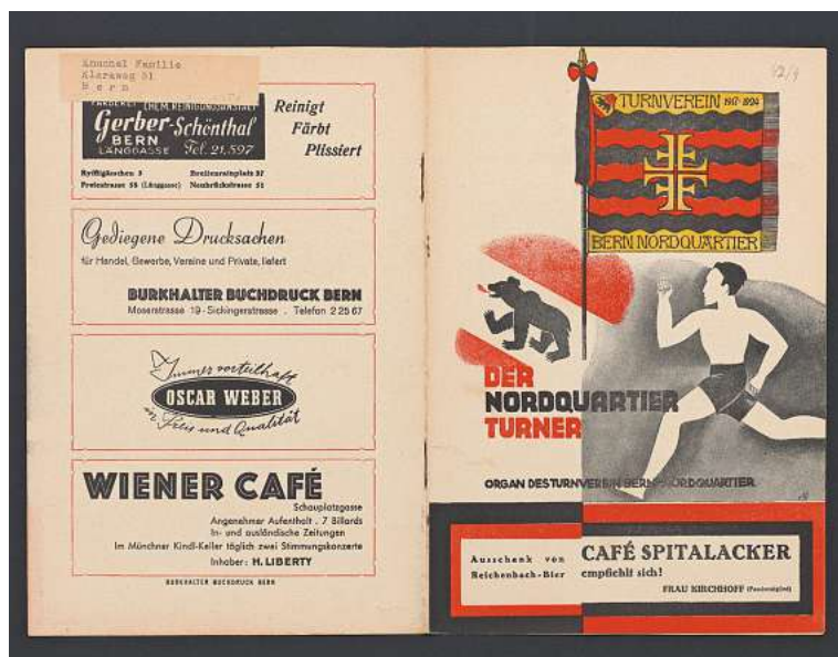
Auszug vom «Nordquartier-Turner».

1942 sogar an die Redaktion eines Vereinsblatts im Nordquartier ging. Es lagert bei der Burgerbibliothek Bern, wo seit 2012 das Archiv des Turnvereins Bern Nordquartier (ab 1956 TV Berna, 2001 Fusion mit dem BTV Bern) zugänglich ist, darunter auch die eine oder andere historische Perle.