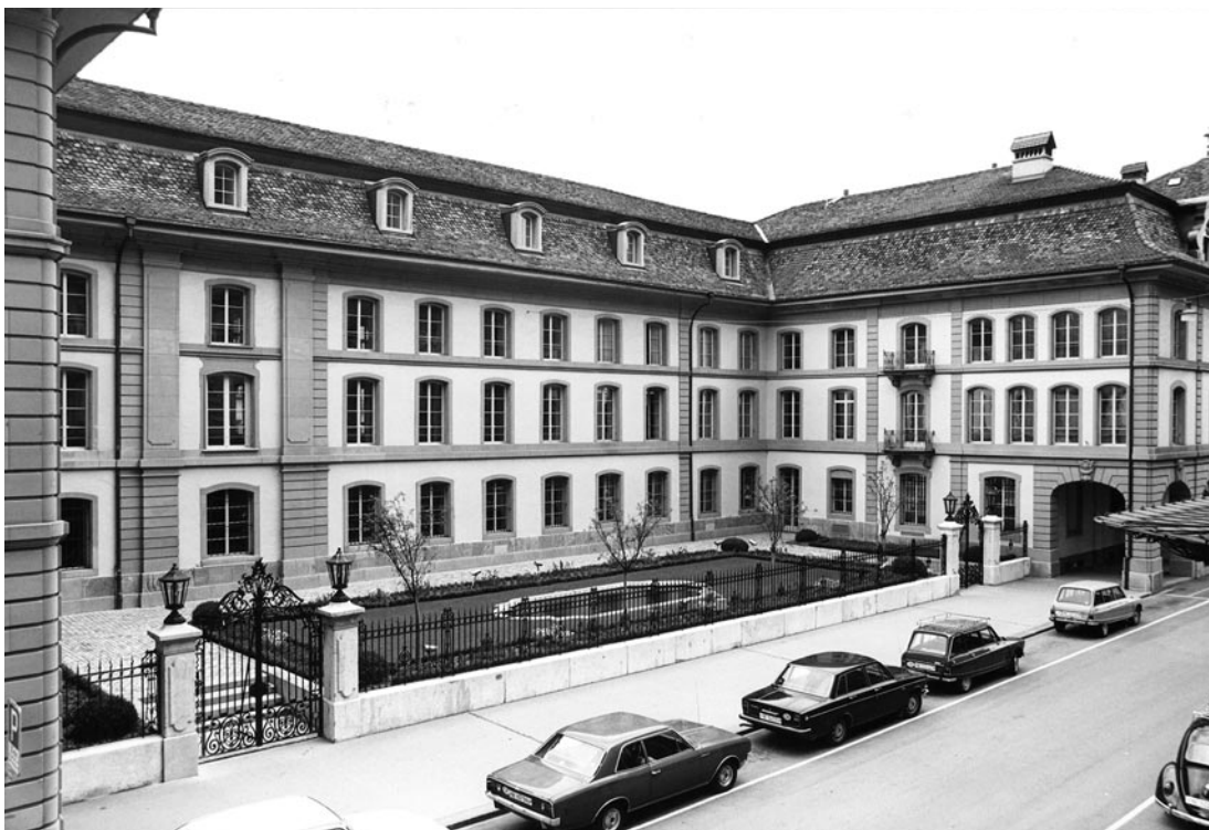
▲ Das Bibliotheksgebäude Münsterergasse nach dem grossen Umbau 1967–1974 von der Herrengasse aus. Unter der im barocken Stil gestalteten Gartenanlage befinden sich die neu erstellten Magazingschosse.